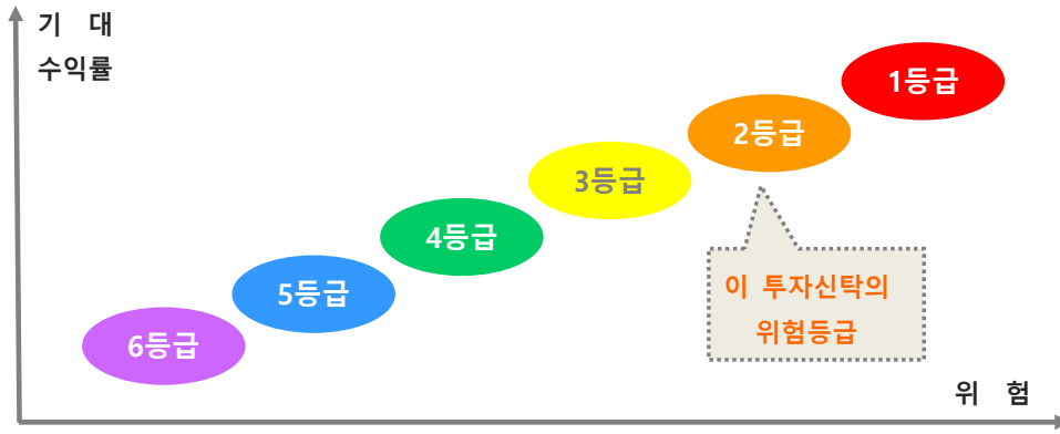
〈한화자산운용 투자위험등급 기준〉

상기의 위험등급은 설정기간 3년이 경과하는 경우 특별한 사정이 없는 한 실제 수익률 변동성(일간 수익률의 최대손실 예상액)으로 등급분류기준이 변경되면서 투자위험등급이 변경될 수 있습니다.